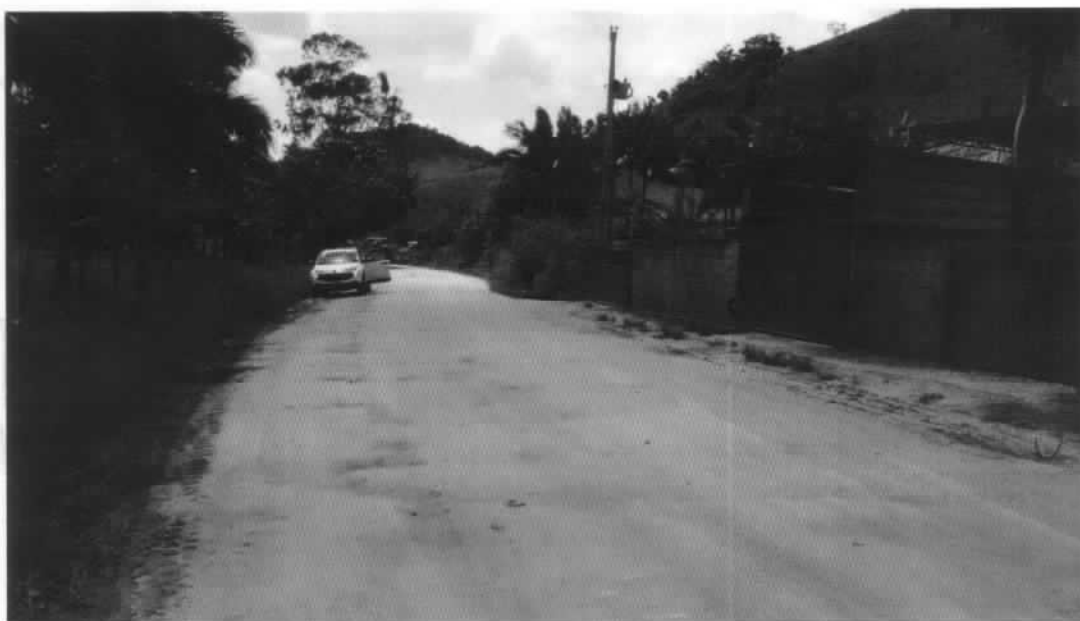
RUA ALTIVO FURTADO PIRES – DATA DO REGISTRO 08/01/2018

OBSERVAÇÕES SOBRE A FOTO: FIM DA VIA A SER PAVIMENTADA COM CBUQ