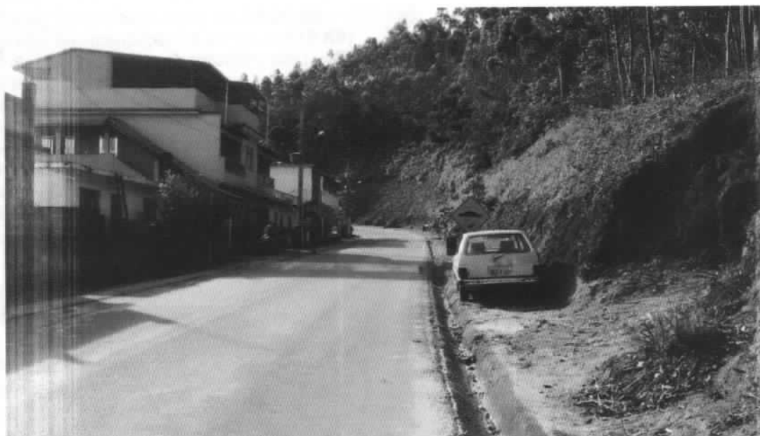
BAIRRO LAVOURINHA – DATA DO REGISTRO 08/01/2018

OBSERVAÇÕES SOBRE A FOTO: LOCAL DE CONSTRUÇÃO PASSEIOS/CALÇADAS COM ACESSIBILIDADE