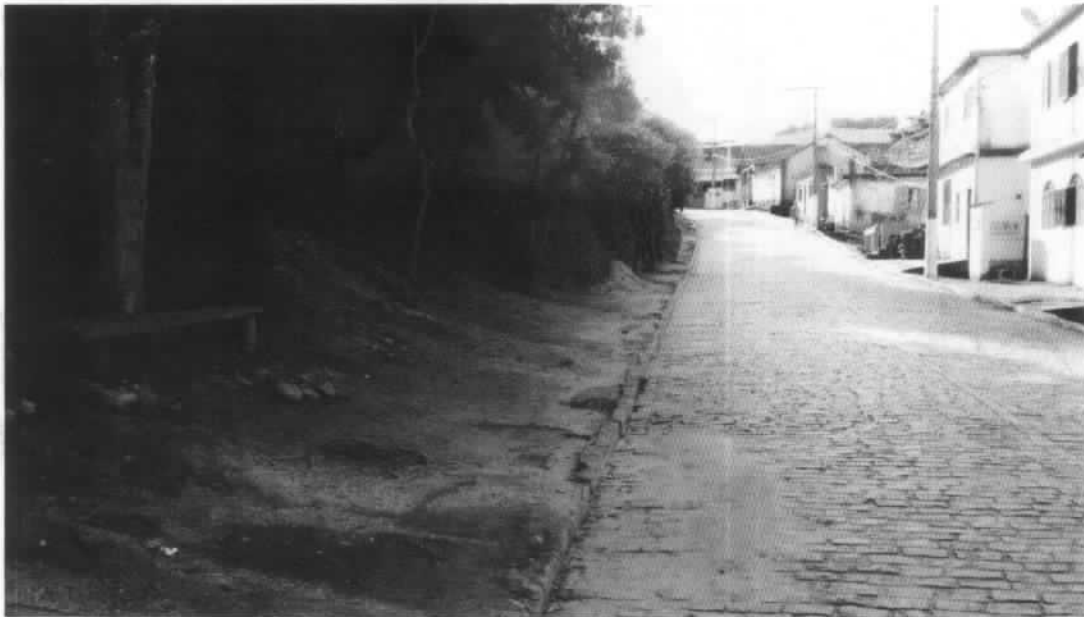
BAIRRO SANTO ANTONIO – DATA DO REGISTRO 08/01/2018

OBSERVAÇÕES SOBRE A FOTO: LOCAL DE CONSTRUÇÃO PASSEIOS/CALÇADAS COM ACESSIBILIDADE