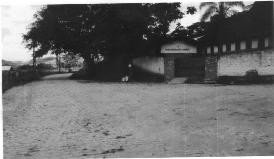
RUA ALTIVO FURTADO PIRES – DATA DO REGISTRO 08/01/2018

OBSERVAÇÕES SOBRE A FOTO: INÍCIO DA VIA A SER PAVIMENTADA COM CBUQ